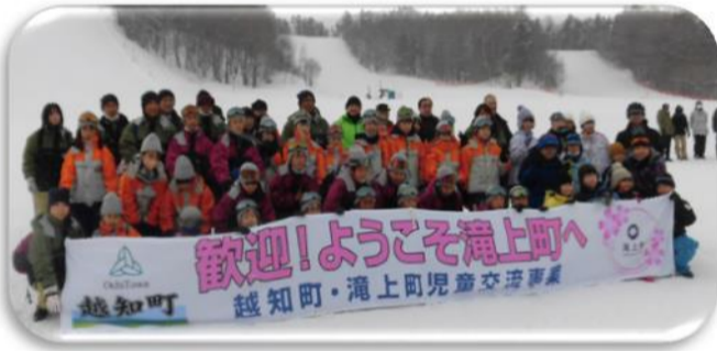
北海道滝上町との交流