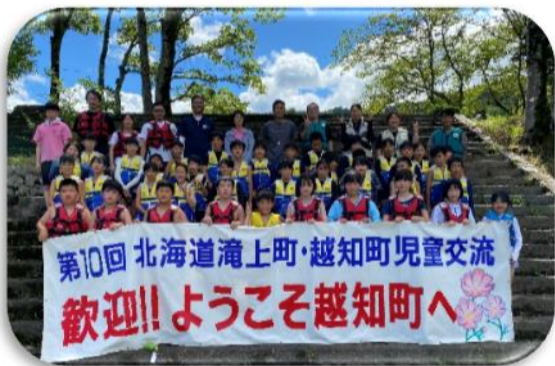
第10回 北海道滝上町・越知町児童交流 歓迎!! ようこそ越知町へ