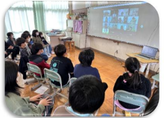
ダラス補習校とのオンライン交流