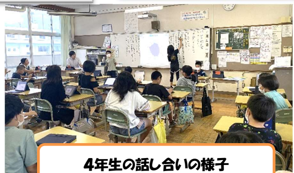
4年生の話合いの様子